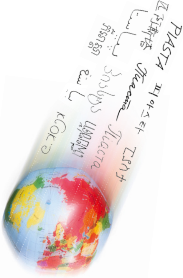
PIASTA - Interkulturelles Leben und Studieren - Intercultural Living and Learning - SoSe 2015