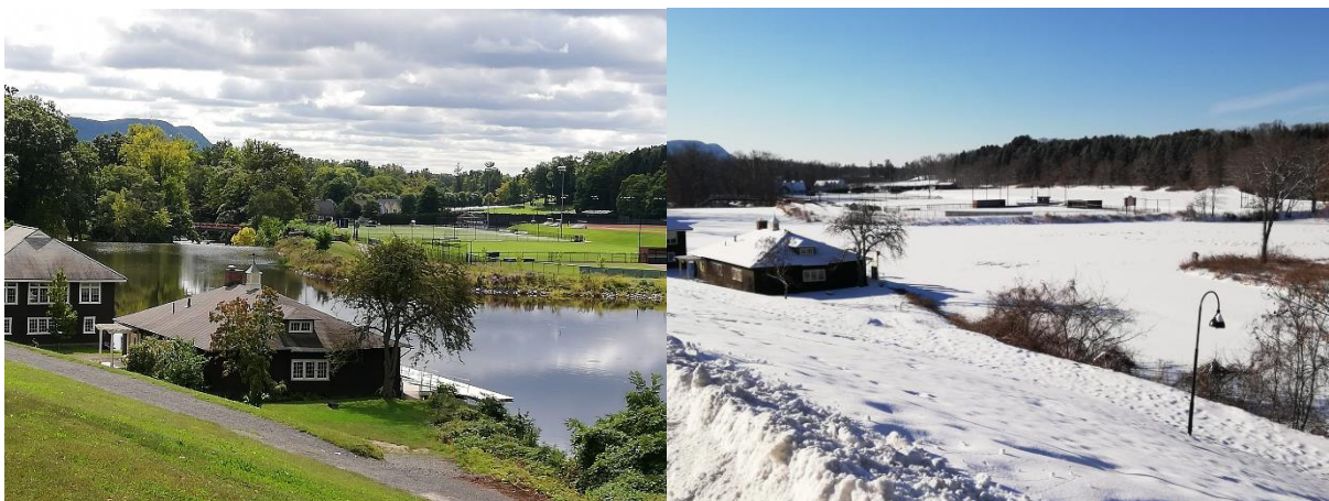
Das Bootshaus am Paradise Pond und die dahinter gelegenen Sportplätze