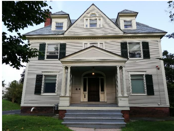
Parson's Annex, das Haus, in dem ich mit den meisten anderen Teilnehmern des Programms auf dem Campus gewohnt habe