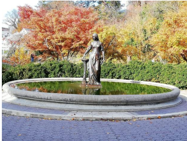
Ein kleiner Eindruck vom neuenglischen Herbst