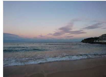
Sonnenuntergang am Bondi Beach

Als ich in Sydney angekommen bin, habe ich erst einmal in einem Hostel an der Central Station gewohnt und von dort ein Zimmer über Flatmates.com gesucht. Obwohl ich letztendlich nur ca. eine Woche gesucht habe, fand ich es schwieriger etwas mit gutem Preis-Leistungsverhältnis zu finden als in Hamburg. Viele Studenten teilen sich Zimmer oder wohnen relativ weit abseits der Stadt (und Strände 😊). Ich habe schließlich in einem privaten Zimmer in Bondi gewohnt und habe dafür 270 AUD wöchentlich gezahlt (= ca. 685 Euro pro Monat im Juni 2018). Das war vergleichsweise günstig (für Sydney) für ein relativ großes Einzelzimmer in der Lage (20 Min zu Fuß zum Bondi Beach) – dafür war die Wohnung aber auch in keinem wirklich tollen Zustand. Zum Vergleich: Der Preis für ein Zimmer im Macquarie University Village liegt für Study abroad/Exchange Studenten aktuell bei 302 Dollar/Woche. Etwas günstiger kann man glaube ich in privaten oder geteilten Zimmern in Uni-Nähe wohnen. Mir war dort allerdings zu wenig los bzw. die Anbindung an CBD/Strände teilweise zu schlecht. In Uni-Nähe würde ich das Wohnen in Chatswood empfehlen.