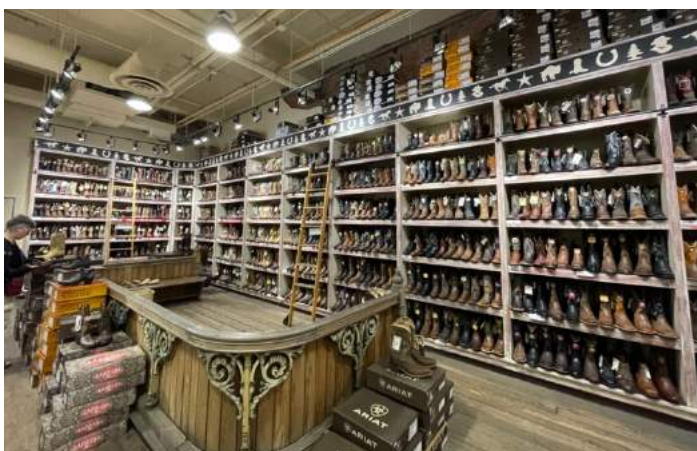
Abbildung 2: Cowboystiefel in 'Cowboy-Town' Calgary