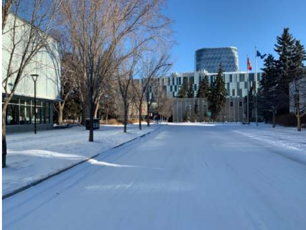
Abbildung 9: Campus im Winter