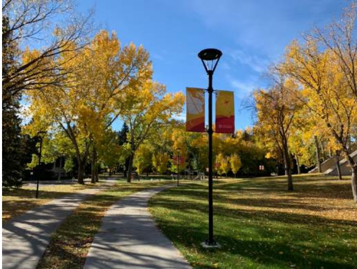
Abbildung 6: Herbst auf dem Campus