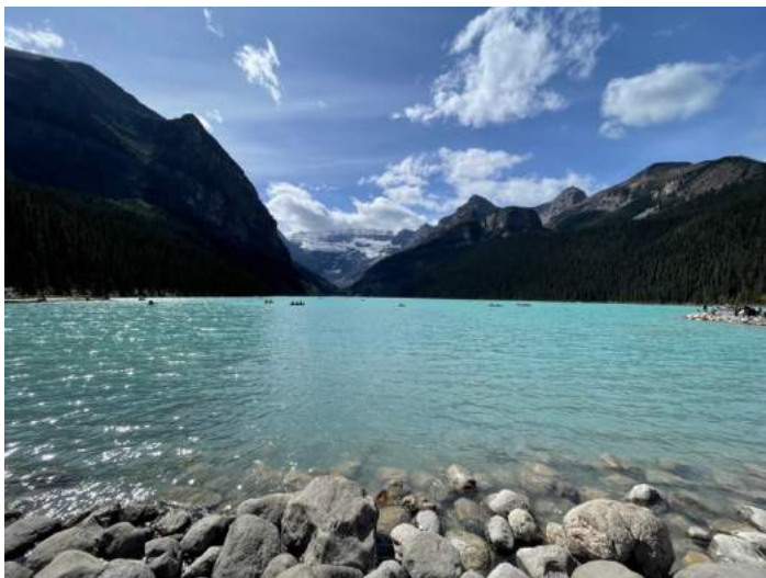
Abbildung 5: Lake Louise