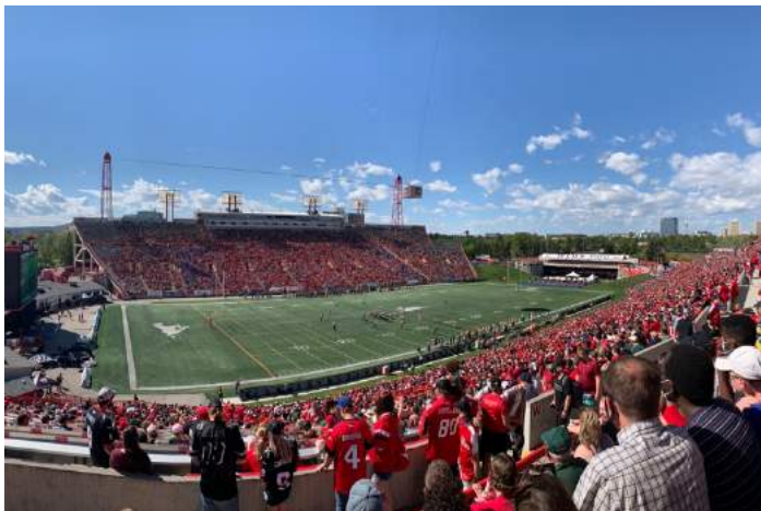
Abbildung 1: Football Game in Calgary