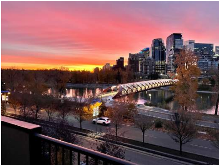
Abbildung 7: Sonnenuntergang vor der Peace Bridge