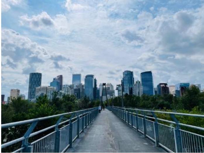
Abbildung 3: Calgary